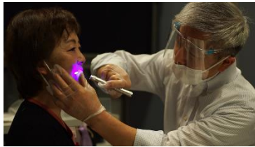
染め出しライトでの歯垢チェックの実演