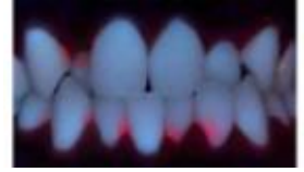
光を照らすと成熟した歯垢が蛍光

口腔内の健康と身体の健康との関係が明らかにされており、適切なケアによる歯科疾患の予防は全世代にとって大切である。特に幼い頃から適切な口腔ケアを習慣化することは重要であり、子育て世代の多いつくば市ではその啓発の意義が大きい。この実証実験では、従来歯磨きの状態を視覚的に確認するために用いられる歯垢着色液よりも、簡便に歯垢を確認できる“染め出しライト”を用いて、子育て世代に対する口腔ケア啓発の方法と効果を検証し、市民サービスの質の向上を目指す。