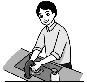
つくば市長 五十嵐立青