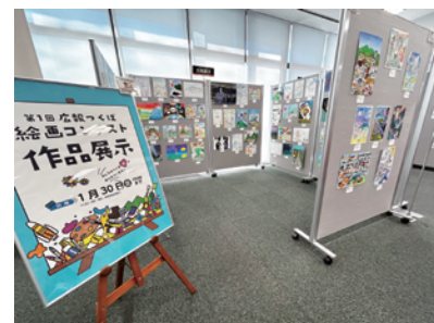
市役所1階 市政情報コーナー展示(写真:2025年度の様子)