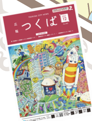
第1回広報つくば絵画コンテスト 最優秀賞作品 (テーマ：魅力あふれるつくば市)

2025年度に開催された広報つくば絵画コンテストでは、つくば愛あふれる素敵な88点の応募作品がありました。今回のテーマは「思い出のつくば」です。あなたの大切な思い出を絵画で表現してください。