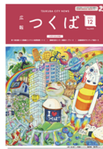
2025年広報つくば12月号

最優秀賞の作品は、広報つくば12月号の表紙に掲載します。そのほかの作品も、紙面上で紹介する場合があります。また、全ての応募作品を、市ホームページや市役所1階の市政情報コーナーなどで展示する予定です。