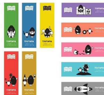
▲しおりデザイン 10種