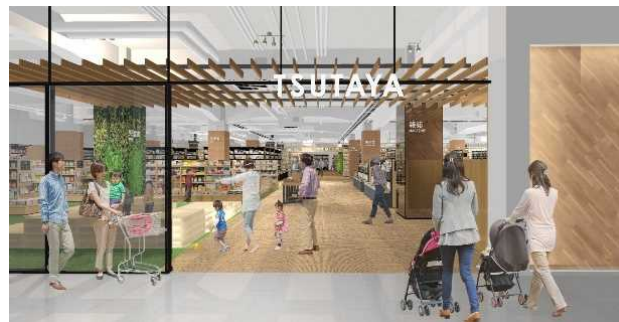
店内イメージ図（児童書側入り口）