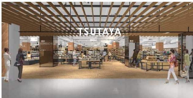
店内イメージ図（正面入り口）