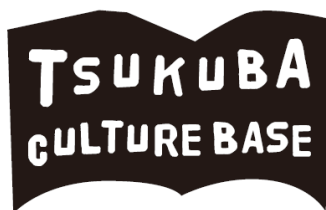
▲店舗ブランドメッセージロゴ

また、店舗オリジナルキャラクターも作成。筑波山型の耳がついた、触ると少しふわふわしているロボットたちのキャラクターです。キャラクターは10種類のデザインでしおりとなっており、店舗で書籍をお買い上げの方に配布します。キャラクターの名前はオープン後、店頭のお客様より募集し、決定予定です。