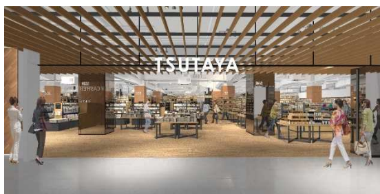
▲店内イメージパース（正面入り口）