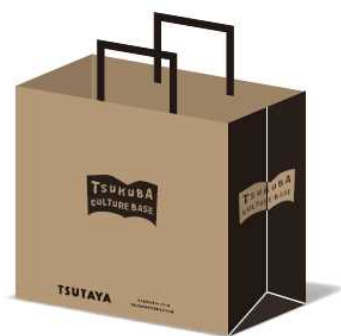
▲販売袋・紙袋（有料）