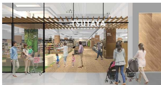
▲店内イメージパース（児童書側入り口）