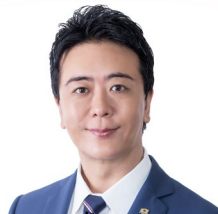
福岡市長 高島 宗一郎