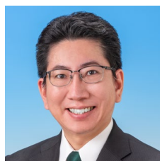
鹿児島市長 下鶴 隆央