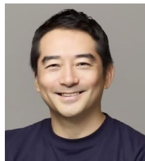
つくば市長 五十嵐 立青

概要：各都市のアントレプレナー人材の発掘・育成戦略について、取り組み内容と課題、今後の展望を深堀りする。