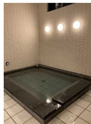
ランナーが利用できるロッカーと風呂