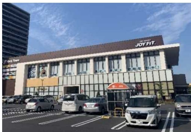
JOYFITつくば竹園の外観

【ポイント】 利用可能な時間が6時から24時であるため、朝出勤前や夜の仕事終わり等、多様なライフスタイルに合わせてランニングを楽しむことができます。また、約150mでペDESTリアンデッキにアクセスできる立地環境も魅力の1つです。