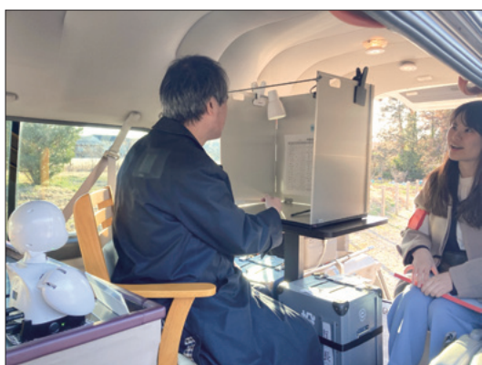
オンデマンド型移動投票所の車内風景

【賛成討論】 一般会計予算は、小中学校給食センターや、保育所や児童クラブなどの整備など、安心できる子育て環境の充実を進めるものである。また、持続可能で包摂的な都市づくりを目指して取り組むとともに、公共施設の老朽化対策やバリアフリー化、再生可能エネルギー利用を促進するもので、市民の多様な幸せづくりをテーマに編成されている。市のまちづくりを進める上で重要であり、市民生活を支えるためのものなので賛成する。