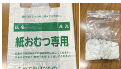
志布志市の紙おむつ専用回収袋と給水ポリマー

(答弁) 使用済み紙おむつのリサイクルについては、高齢化などに伴い、排出量がさらに増加することが見込まれ、焼却処分量の削減、リサイクルによる再資源化が全国的に課題となっているが、現時点で民間企業との連携・協力なしには、リサイクルすることが困難な状況にあると認識している。現在市では、使用済み紙おむつは、燃やせるごみとして処理しているが、今後、家庭をはじめ保育所や老人福祉施設などからの排出量の増加が想定されるので、令和6年度に予定している一般廃棄物処理基本計画の改定時に実施する、ごみ組成分析調査で状況を把握するとともに、他自治体の事例などを調査研究していく。