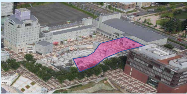
新たな市民活動拠点「コリドイオ」

【意見】 これからの複合型コミュニティセンターの基軸になる条例であり、この条例にのっとり運営していくことが大事である。この施設は交流センターと異なる施設であり、しっかりと棲み分けして運営する必要がある。条例に反対するものではないが、吾妻交流センターを使用していた一般利用者の選択肢が消えてしまったとの印象がどうしても拭えない。