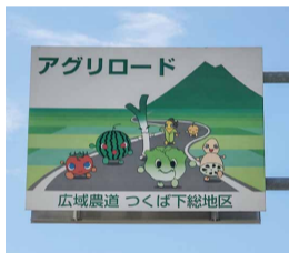
アグリロード 広域農道つくば下総地区

雑が発生していることは認識をしていた。市としても、朝夕の時間帯の交通混雑はあるものと認識をしている。②今後、西側への新たな道路整備については、地元の方などの意見を伺いながら、常総市と協議していく必要があると考えている。