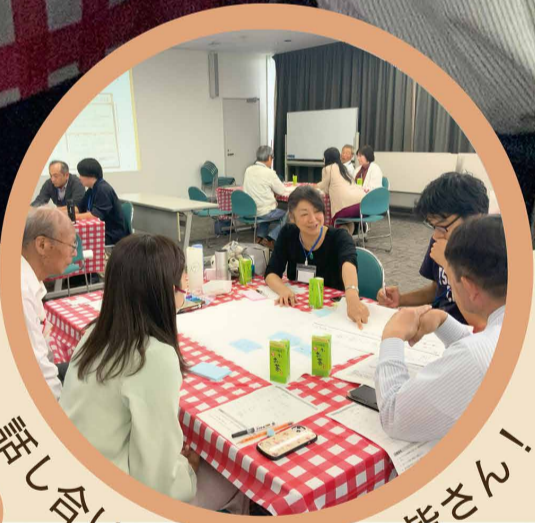
話し合いの主役は市民の皆さん！