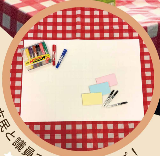
市民と議員でワークショップ！

「つくば市の好きなところをもっと良くするには？」というテーマで 市内3会場でワークショップ形式の意見交換を行いました