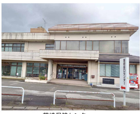
茎崎保健センター

要望 エレベーター設置の見送りについて、設置費用や工事期間の延長で開館が遅れることを理由に挙げたが、高齢化の進む地域にとっては施設の利用手