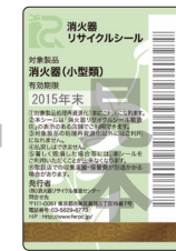
既製品用シール (見本)