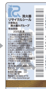
新品用シール (見本)

製品にはリサイクルシールが貼られています。耐用年数を過ぎたら、取り扱い窓口へ引き渡してください。