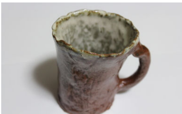
こんなカップが出来ました！

いくらい降っています。つくばに到着して解散するときが心配でしたが、幸運なことにつくばに入ると雨が上がっていました。よかったよかった。