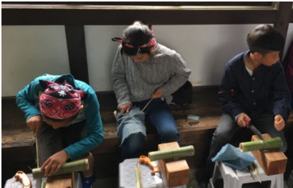
「竹細工の家」での体験

今年の参加者数は子ども 46 名、大人 26 名の総勢 72 名でした。体験盛りだくさんで充実した 1 日でしたが、バスに乗っている時間がちょっと長かったかな。次年度はもう少し近場での楽しい企画にしたいと考えていますので、皆様のご参加をお待ちしております。