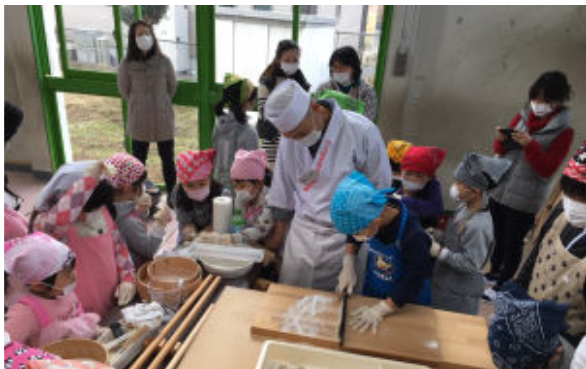
上手に切れてるよ！

このそば打ち体験は、なかなか家庭では学べないそば打ちを名人に手取り足取り教わることのできる人気の事業です。