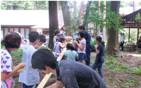
サマーキャンプ恒例の流しそうめん

豊里地区子ども会育成連合会の恒例行事のひとつ「サマーキャンプ in ゆかりの森」は今年で 19 回目を迎え、7 月 29、30 日に実施しました。今回の申込者は 55 名で、夏休み一番の思い出になったのではないのでしょうか。