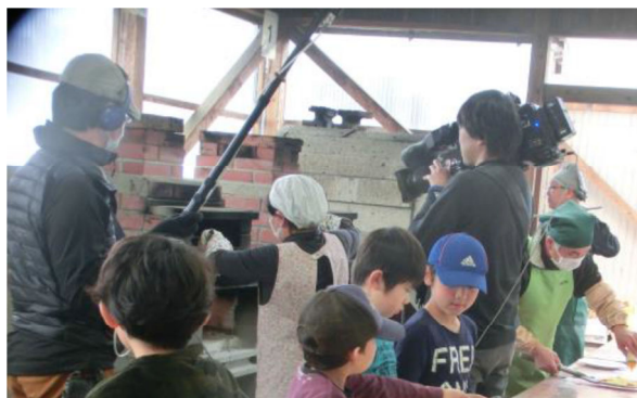
ピザ作りの様子は NHK で放映されました

3 月 24 日には春うららの宝篋山へ「春のハイキング」に行きました。参加者は 22 名で、山麓の棚田を巡り、岩場や沢筋を進み、尾根筋でつくば市内を一望すると遠くにスカイツリーも見えました。下山後は朝日里山学校でピザ作りに挑戦しました。この日はNHKの取材がありましたが、子ども達は物怖じすることなく、インタビューに応じていました。楽しい一日となりました。