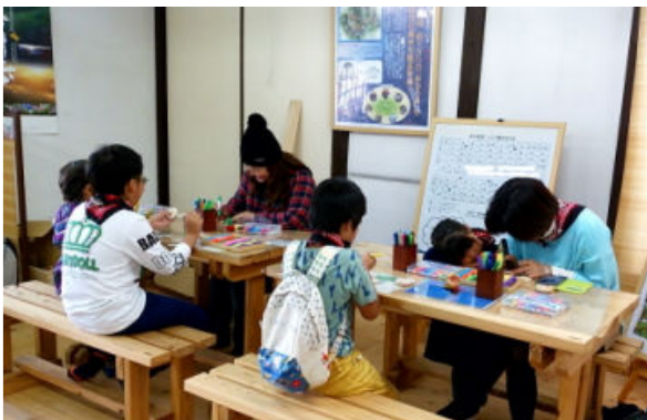
「森の恵と学びの家」での体験