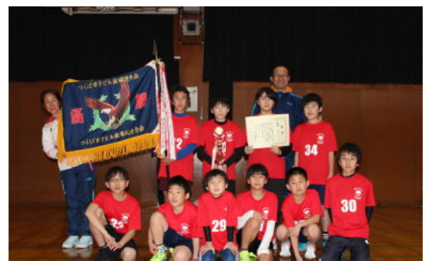
優勝した桜サンダー おめでとう！

昨今、子ども達を取り巻く環境は時代と共に目まぐるしく変化しています。そういった中で学校や家庭では得られない多世代の交流、子どもの心