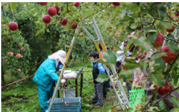
真っ赤なリンゴがたくさん！