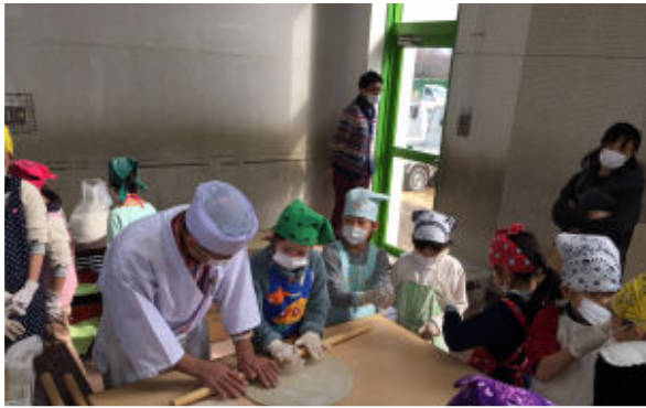
よーく伸ばします