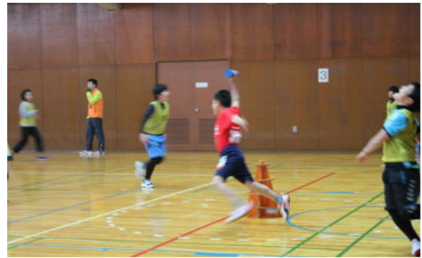
取ったー！（取られた〜）

決勝リーグは、たくさん子ども達と保護者の大声援の中で行われました。激闘の結果、優勝チームは桜サンダー、準優勝チームは桜ファイブ、第3位は九重ミックスでした。また交流戦も行われ、優勝チームはもちろん、どのチームもお互いの健闘を讃え合い、楽しかった、来年もやりたいと額の汗を拭いながら生き生きとした表情と笑顔を見せてくれました。