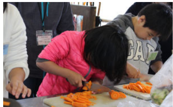
包丁を上手に使っています

その後、屋外の炊飯場に移動してバーベキューの準備です。雨は相変わらず降っていますが、風