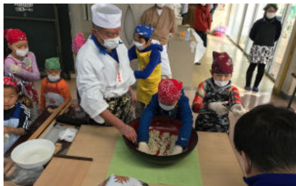
よく水を回します

毎年たくさん子ども達や保護者が参加してくださる事業ですが、おなじみのご家族もいたりして、とても和気あいあい、楽しい一日を過ごすことができました。