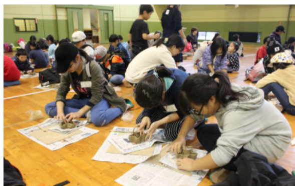
どんな器にしようかな？