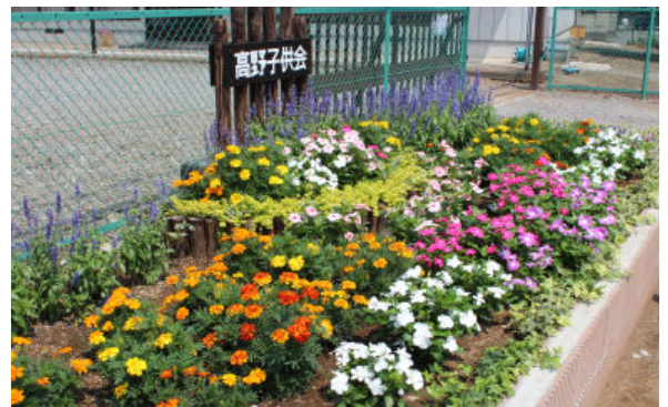
最優秀賞 高野子ども会の花壇

花壇は地域の人々みんなに安らぎを与えてくれます。水遣りや草取り等の日々の管理は手間が掛かりますが、地域の他団体と子ども会が協力して取り組むことも可能です。現在、花壇制作をしていない地区や子ども会さんも、地域を花できれいにする活動に取り組んでみられてはいかがでしょうか？