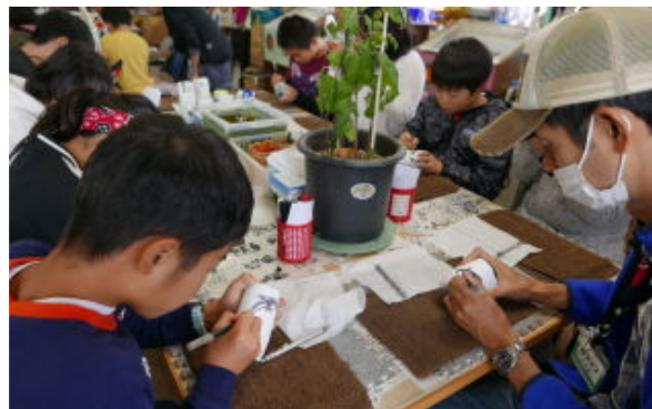
「ガラスの家」での体験