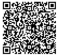
つくば市ホームページ

つくば市電子申請（新規登録）で必要事項を入力(右のQRコードからもアクセスできます。) ※窓口での登録を希望される場合は、事前に生涯学習推進課に御相談ください。