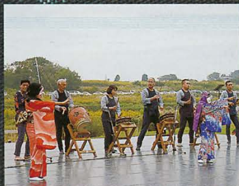
市指定無形民俗文化財 「上境ひょっとこ」（上境地区）