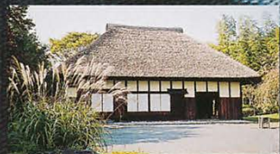
横田家住宅（大角豆地区から つくば市吾妻中央公園内に移 築復元）【お問い合わせ：さくら 民家園 029-858-2798】