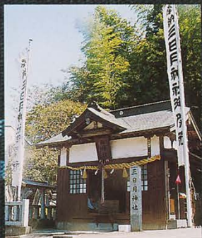
三日月神社祭礼（吉瀬地区）