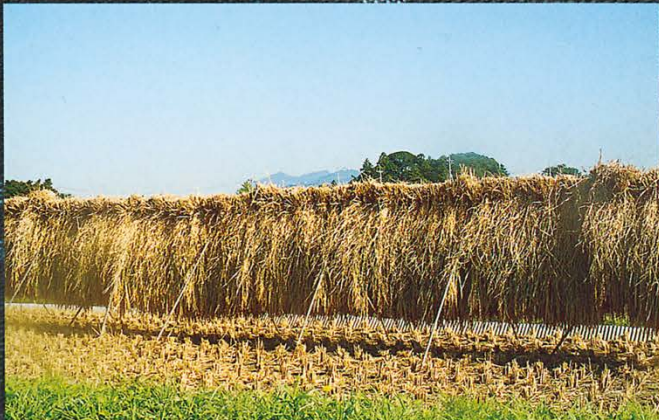
稲作（おだかけ）（大地区）

伝統文化は記憶や記録の中だけのものではありません。都市化が進んだ現在でも脈々と受け継がれているものもあるのです。