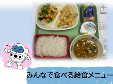
みんなで食べる給食メニュー