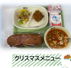
クリスマスメニュー