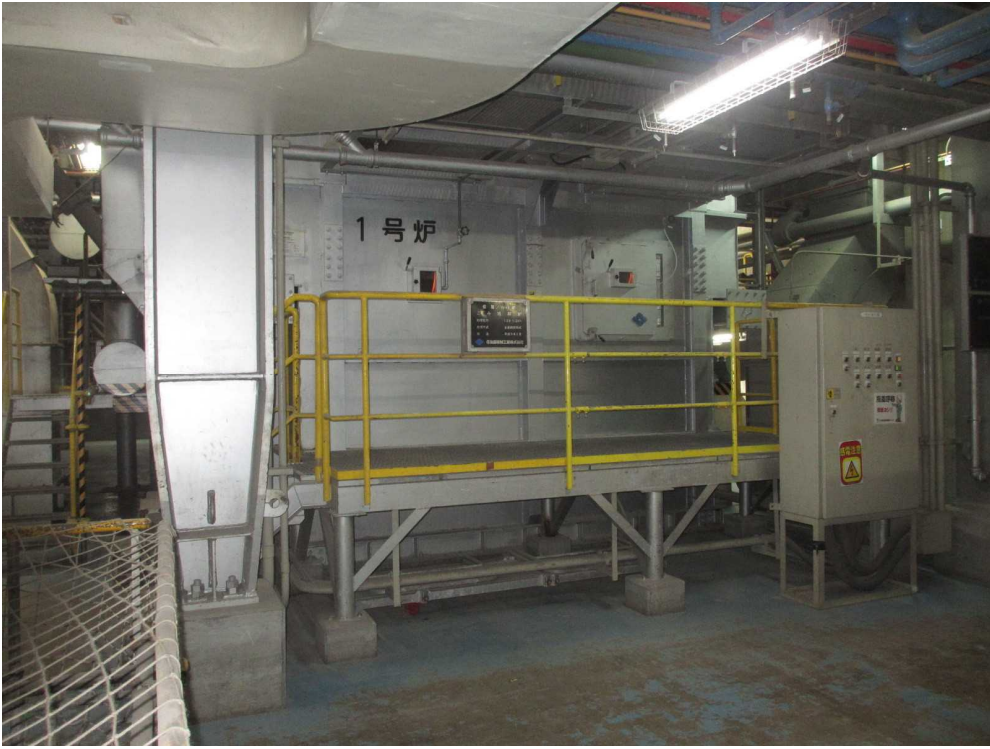
改修対象 (焼却炉外觀)