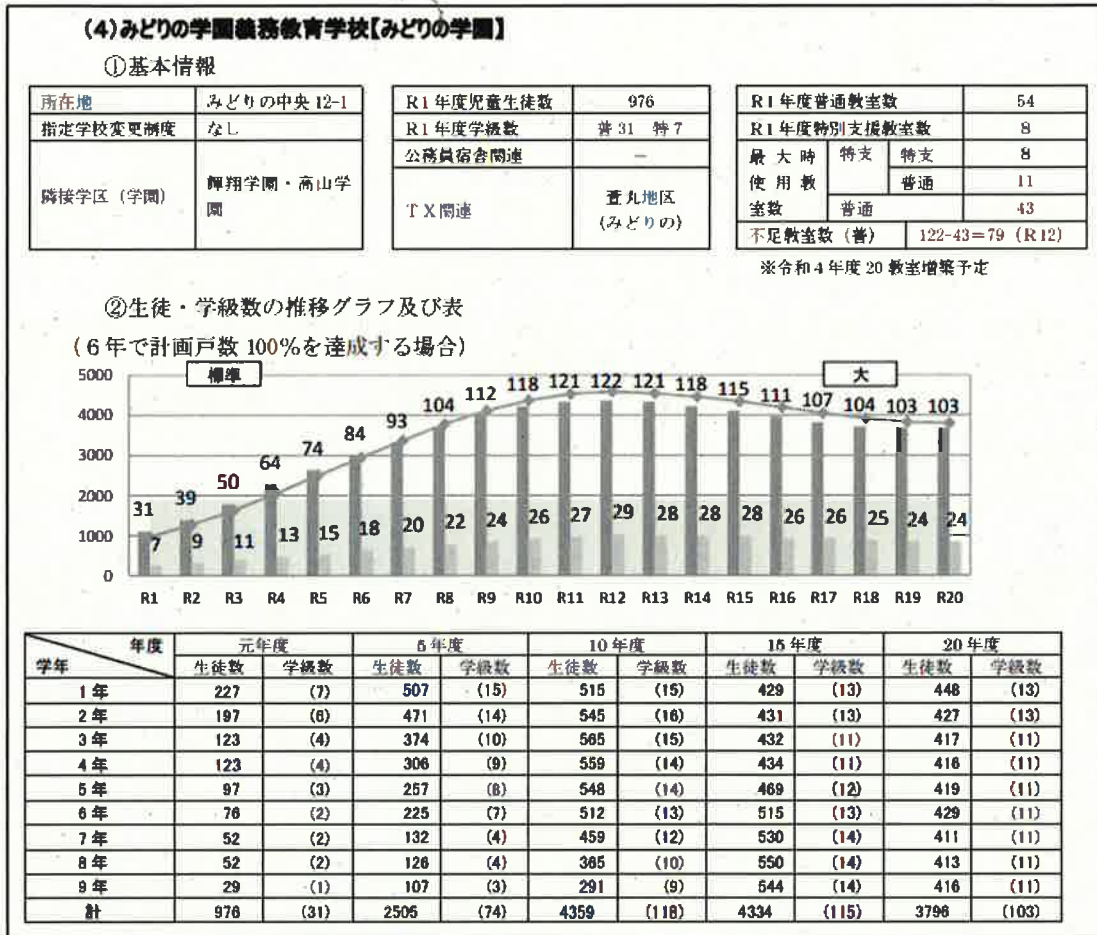
図3. みどりの学園義務教育学校の生徒・学級数の推移グラフ及び表 (参考資料①の55ページ)