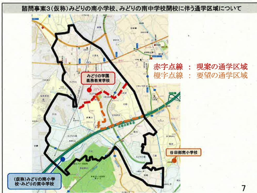
図 4. 要望の通学区域について (参考資料②を引用)