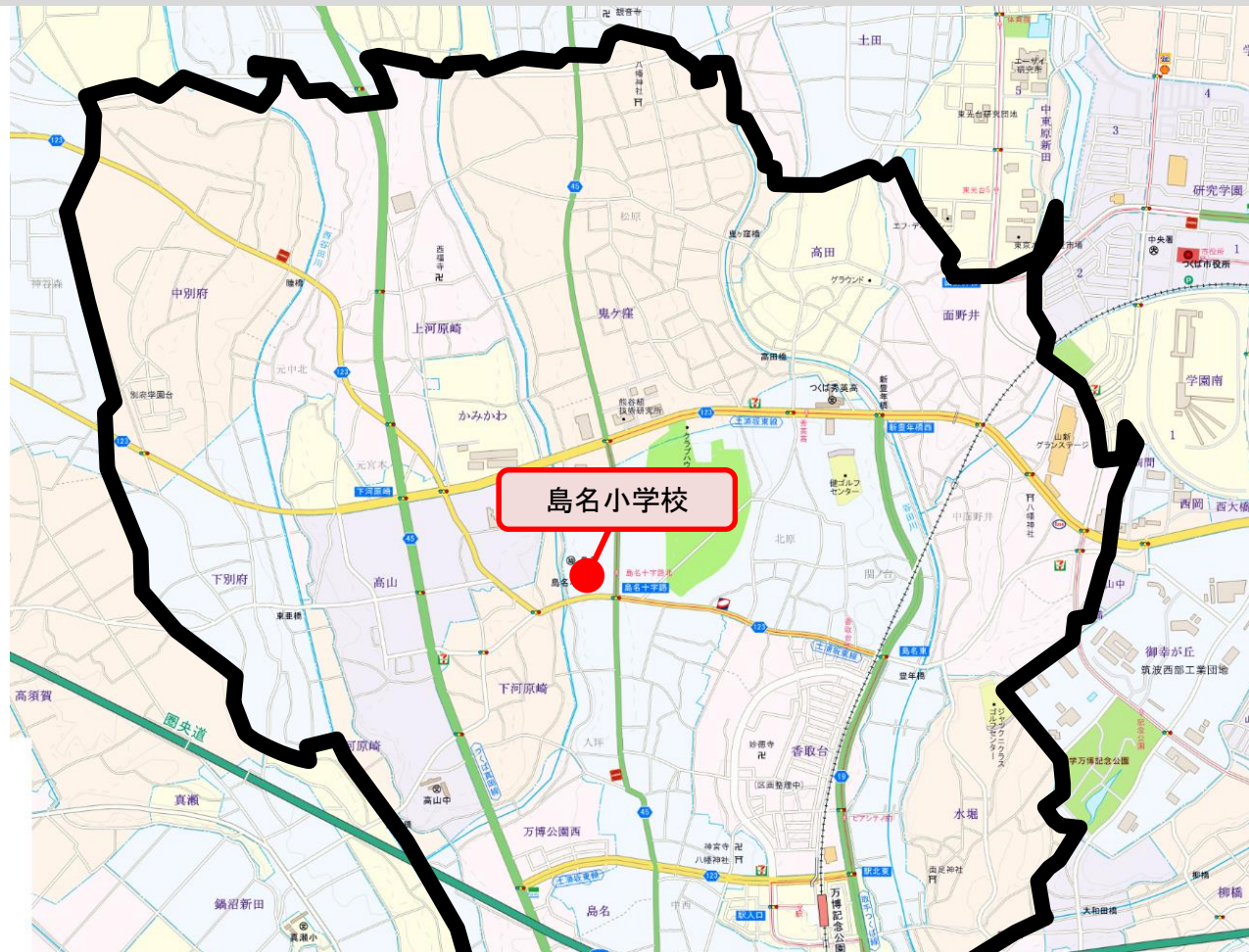
島名小学校通学区域(現在)