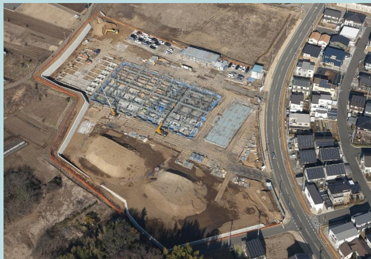
令和4年1月17日現在の工事の様子