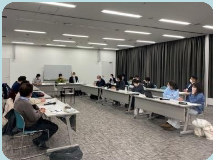
開校準備委員会の様子

開校準備委員会を含めた新設校に関する詳細については、つくば市HPIにも掲載しています。