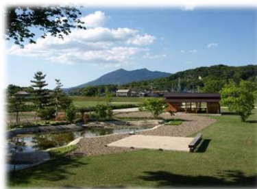
小田城跡歴史ひろば