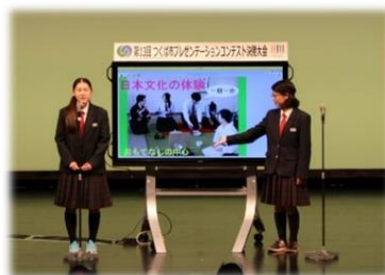
プレゼンテーションコンテスト