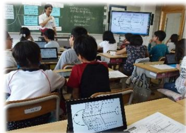
電子黒板とタブレットを活用した授業