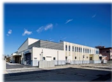
つくばすこやか給食センター豊里