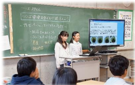
児童が電子黒板を使って発表