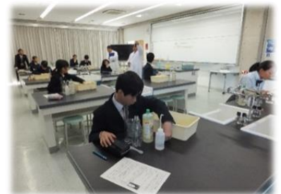
サイエンスキッズリーグ