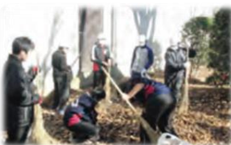
環境美化活動の様子

平成27年度中学生未来議会 「508撲滅宣言」 人は誰もが人権を持っています。その大切な人権をうばうのが「いじめ」です。つくば市の小中学校では、いじめをなくすための活動を行っています。その活動を通して、私たちは他人を思いやる気持ちを育んでいくべきだと思います。私たちの大切な仲間一人一人の輝かしい明日をつくるために、つくばの未来を担っていく私たち中学生はここに決意しました。 — 私たちは「認め」ます！ 自分の心を開き、 一人ひとりの個性を認め合います。 — 私たちは「支え合い」ます！ 困っている人がいたら、 手を差し伸べます。 — 私たちは「行動し」ます！ 見て見ぬふりをせず、仲間と 協力をして、いじめをなくします。 以上、私たちのまちつくばが未来に向けてさらなる飛躍を遂げることができるよう、私たち一人ひとりが心一つにし、「いじめのない笑顔あふれる学校づくり」に取り組んでいくことをここに宣言します。 平成28年1月27日