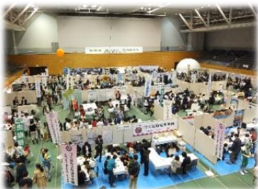
つくば科学フェスティバル