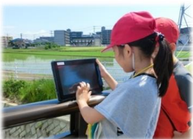
タブレットを屋外で使った調べ学習