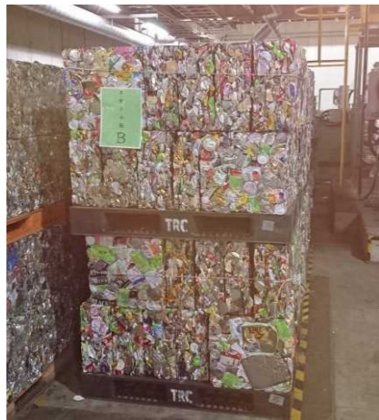
写真：リサイクルセンター 保管場所