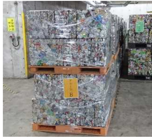
写真：リサイクルセンター 保管場所