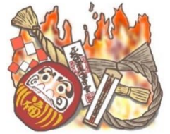
例：どんと焼き (お焚き上げも含む)

禁止の例外であっても、 周辺住民の生活環境への影響がある屋外焼却の 場合は、行政指導の対象となり、中止指導を行っています。