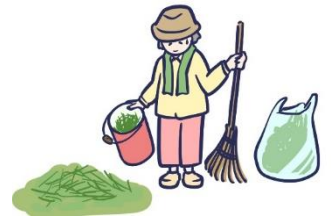
例：刈った芝の焼却