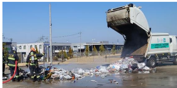
令和6年3月14日 ごみ収集車火災事故の様子