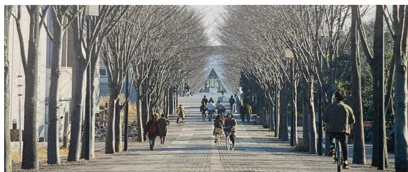
筑波研究学園都市の並木道