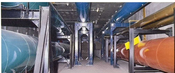
筑波研究学園都市の地域冷暖房共同溝