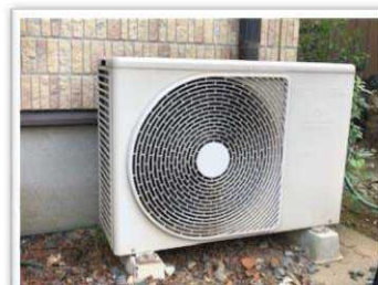
室外機周辺はきれいに！

室外機の周り（特に吹き出し口）にもものを置くと、冷房効果が低下します。室外機の周りはきれいに片付けましょう。