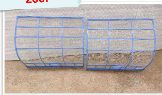
清掃後のフィルターの写真の例

今回は、皆さんにサポーターズ会員として「お掃除大作戦」企画への参加をお願いします。