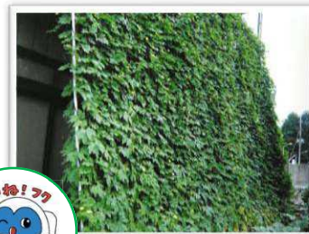
グリーンカーテン

エアコンの冷気を扇風機や送風機で部屋中に循環させることで、体感温度を下げ、いっそう涼しく感じられます。