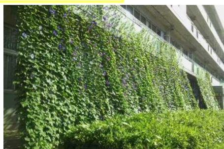
優秀賞 豊里中学校様