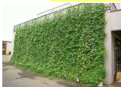
最優秀賞 星田建設工業株式会社様