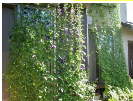
最優秀賞 松井 画里様