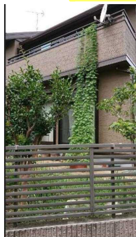
最優秀賞 宮森 みどり様