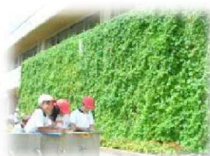
学校の部 最優秀賞