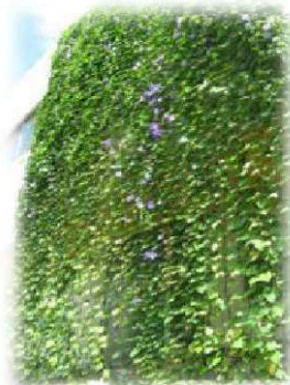
事業所部門 最優秀賞