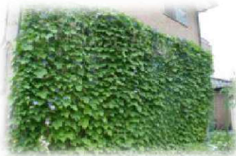
家庭の部 最優秀賞