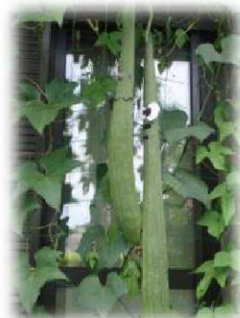
ユニークフォト部門 最優秀賞

昨年から開始しましたグリーンカーテンコンテスト、今年も開催いたします！詳細は、次号以降のサポーターズニュースなどでお伝えいたします。ゴーヤの苗配布もすこーしだけ予定しています。