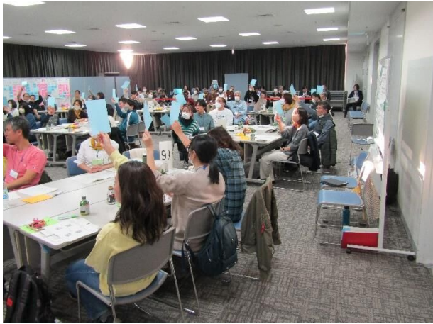
投票フォームの確定