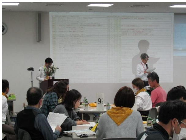
予備投票結果の確認