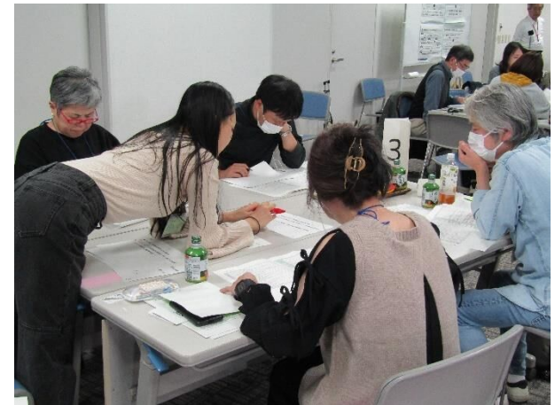
グループでの意見交換