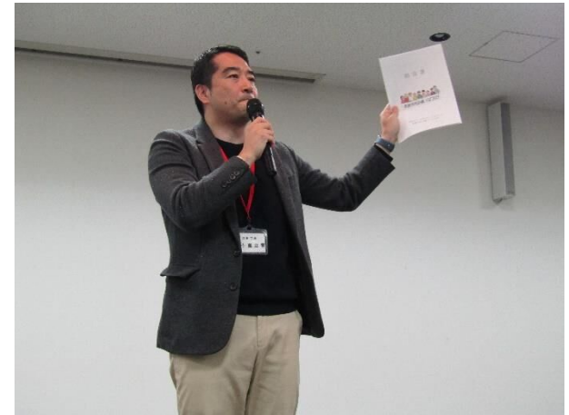
市長あいさつ (つくば市長 五十嵐 立青氏)