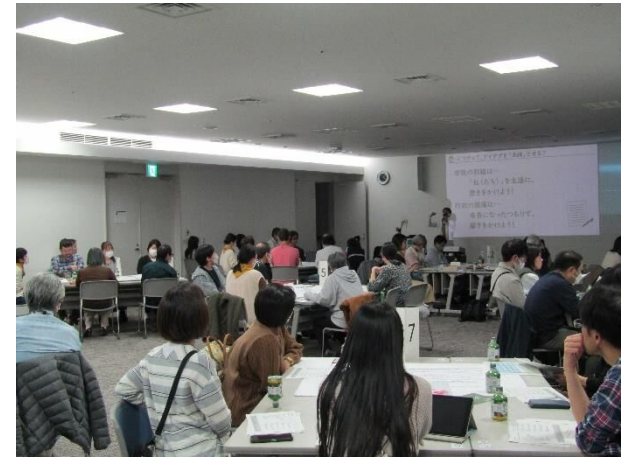
最終成果物のイメージを知る