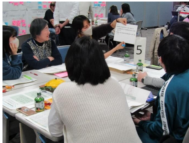
グループでの意見交換