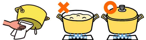
鍋の上手な使い方