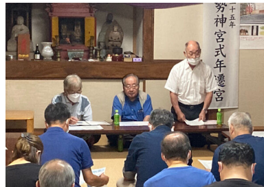
山中地区懇談会の様子