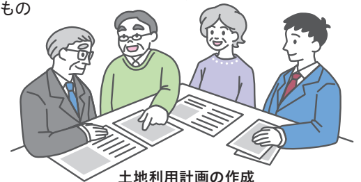
土地利用計画の作成