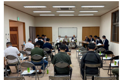
手代木地区懇談会の様子