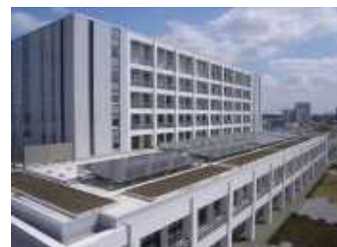
展示会場② 本庁舎 1F情報コーナー