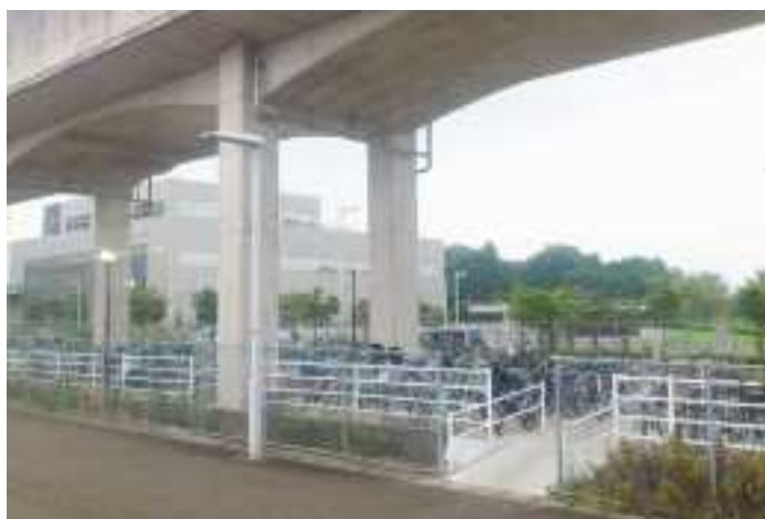
研究学園駅西側駐輪場の現在の状況