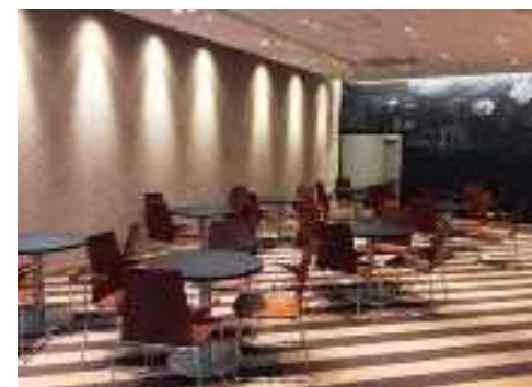
展示会場① BiVi つくば