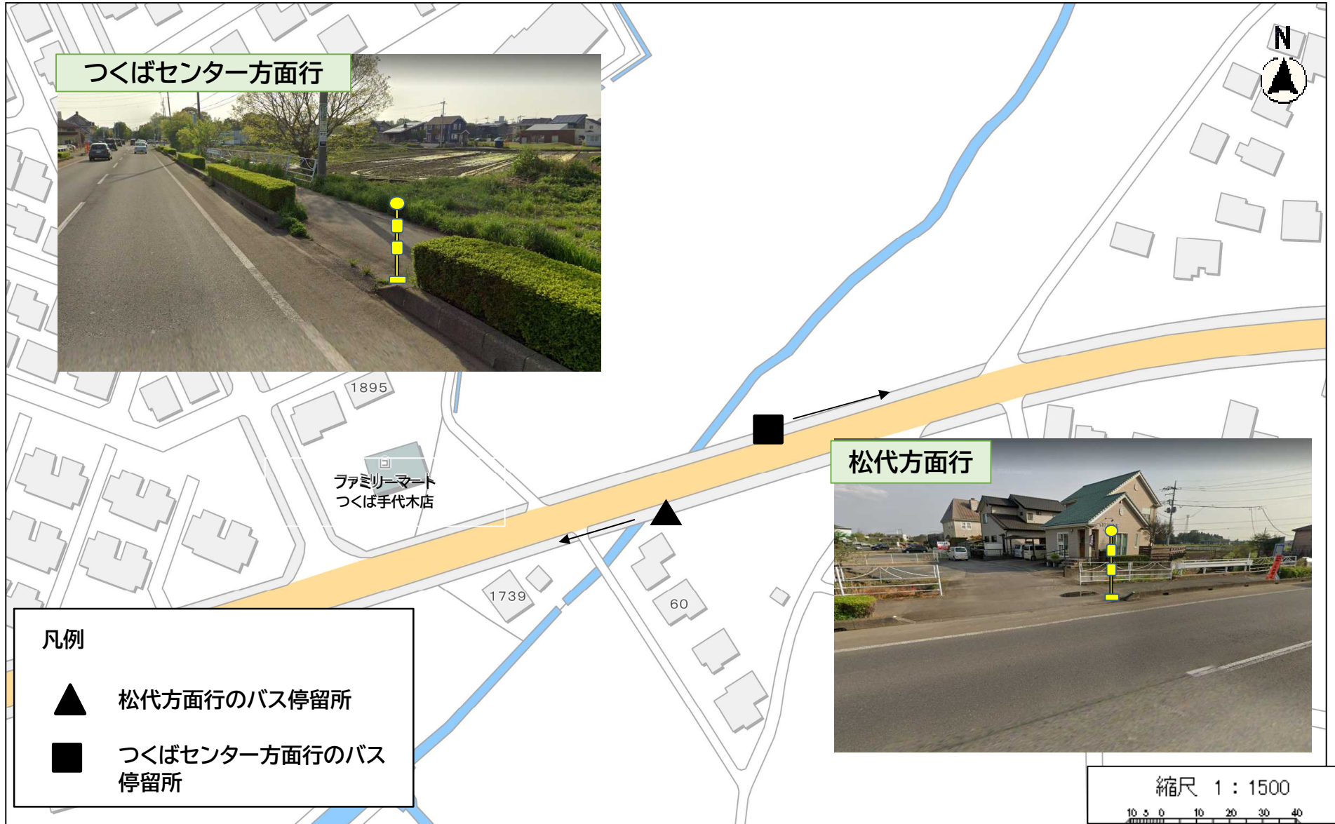
つくばセンター方面行