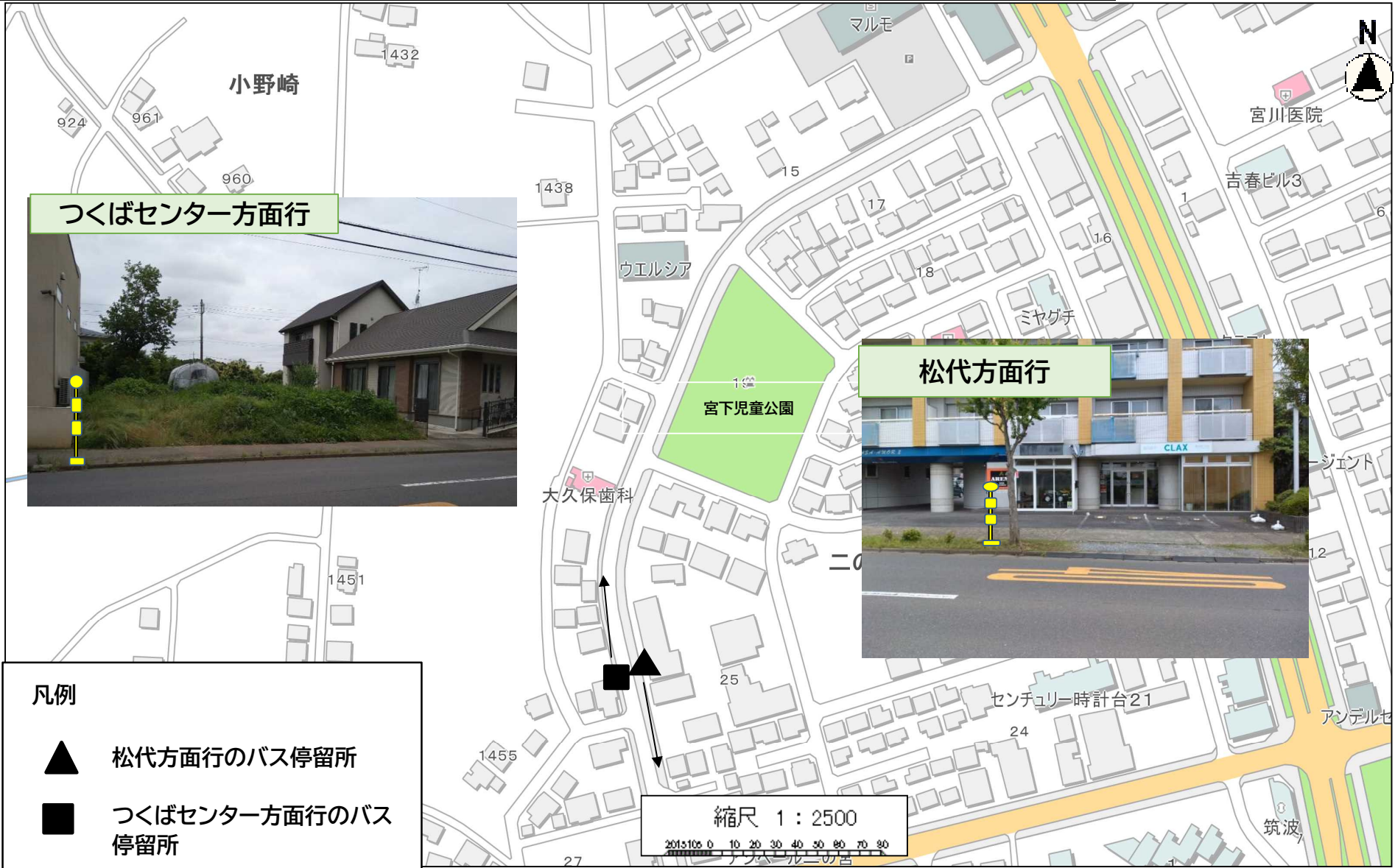
つくばセンター方面行