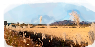
筑波山の風景 (金田)

土浦学園線をはさんで南北に広がる地域。ここも栄なんですよ。知らない人も多いかも。吉瀬から通う小学生はきっと足腰が強い元気な子供になるでしょう！がんばれ！