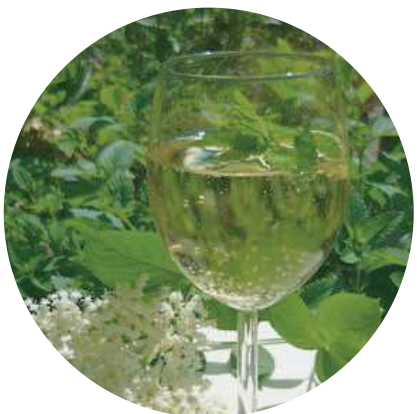
大曽根市街地 × スイス ホルンダーブリューテンシロップ

2020東京オリパラにおけるスイスオリンピックチームのトレーニングキャンプ地となっているつくば市。多くのスイス人観光客の訪問も見込まれ、スイスの方々にも喜んでもらえるような夏のドリンクを開発。「ホルンダーブリューテンシロップ」はスイスの「ホルンダー」という花のシロップを、水とクエン酸と砂糖に漬けこんだフレーバーウォーターだが、ホルンダーを大曽根市街地の花きで代用し、日本ならではのフレーバーウォーターに仕上げたもの。