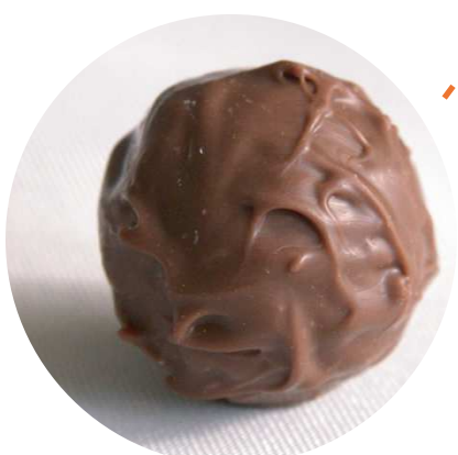
上郷市街地 × スペイン 無花果チョコレート

吉沼市街地で話題の「ミートショップいちむら」の鶏から揚げ。相性抜群なのが中国で古くから使われている万能調味料「葱醬/ねぎじゃん」です。つくば市はなんととっても有数の葱の産地。地元産葱で作った葱醬とから揚げをあわせたものを「吉沼★油淋鶏」と命名。あつあつを召し上がれ！