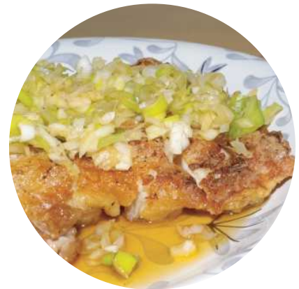
吉沼市街地 × 中国 吉沼★油淋鶏 つくば産葱醬添え

吉沼市街地で話題の「ミートショップいちむら」の鶏から揚げ。相性抜群なのが中国で古くから使われている万能調味料「葱醬/ねぎじゃん」です。つくば市はなんととっても有数の葱の産地。地元産葱で作った葱醬とから揚げをあわせたものを「吉沼★油淋鶏」と命名。あつあつを召し上がれ！