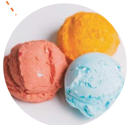
北条市街地 × 多国籍料理 北条マيسクリーム 多国籍フレーバー

サイクリストや登山客が手軽に食べられるように考案されたお手軽メニュー。米に合うのはなんといってもカレー。本格的なスパイスがピリリと美味。