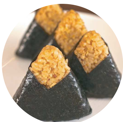
小田市街地 × インド カレーおむすび

いちじくの生産者がいる上郷市街地。ドライ無花果をチョコレートでコーティングしたお菓子が有名なスペインのお土産「ラビトロワイヤル」をヒントに、上郷版の無花果チョコレート菓子を作りました。