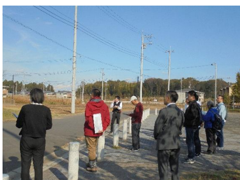
（上河原崎・中西地区 グリーンフィールド島名）