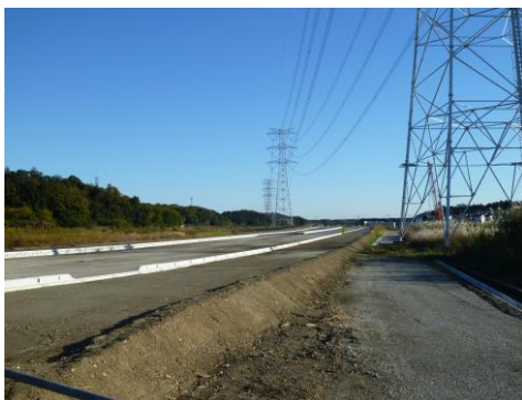
写真③（施工中の新都市中央通り線）