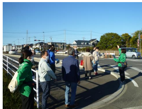
写真②（現地見学の様子）