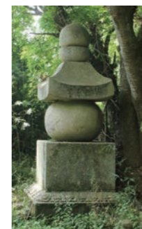
「湯地藏」とも呼ばれて、今も崇拝されています

◆ 三村山極楽寺跡 五輪塔 D1 極楽寺の奥の院ともいえる山際にあります。高さ3mで鎌倉後期の堂々たる作品です。忍性の後に住職に就いた頼玄(らいげん)の墓の説もあります。市指定文化財。