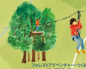
フォレストアドベンチャー・つくば ジップスライド