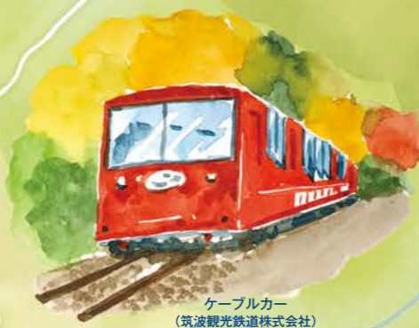
ケーブルカー (筑波観光鉄道株式会社)

本コースは、小さな田んぼも残る燧ヶ池（ひうちがいけ）の風景を楽しみ、麓をのぼりながら巨石信仰のある飯名（いな）神社や月水石（がっすいせき）神社を訪ね、江戸時代の参詣道「つくば道」に合流する片道3kmの道です。ぜひ歩いてみてください。