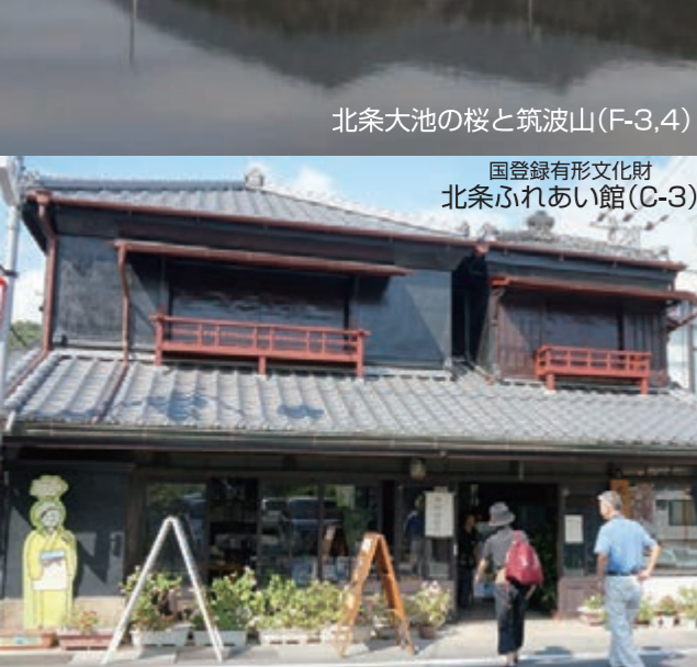
北条大池の桜と筑波山(F-3,4)