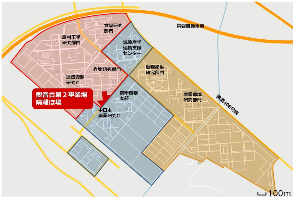
図 1 農研機構観音台地区周辺の地図と観音台第 2 事業場隔離ほ場の配置