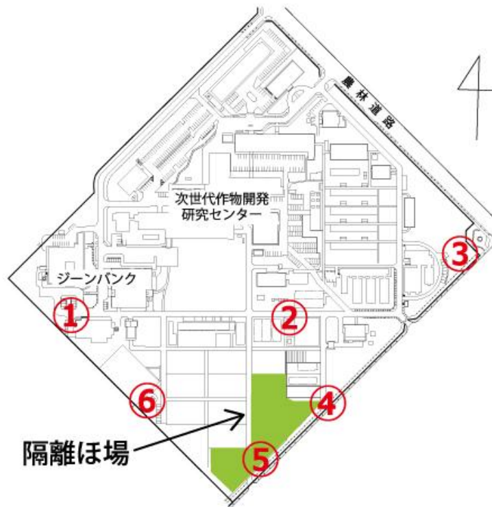
図 3 観音台第 2 事業場隔離ほ場（緑色）周辺のモニタリング用モチイネの設置場所 ①から⑥の位置で、花粉飛散モニタリング用モチ品種「はくちょうもち」を栽培します。