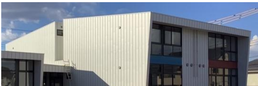
かつらぎ交流館外観