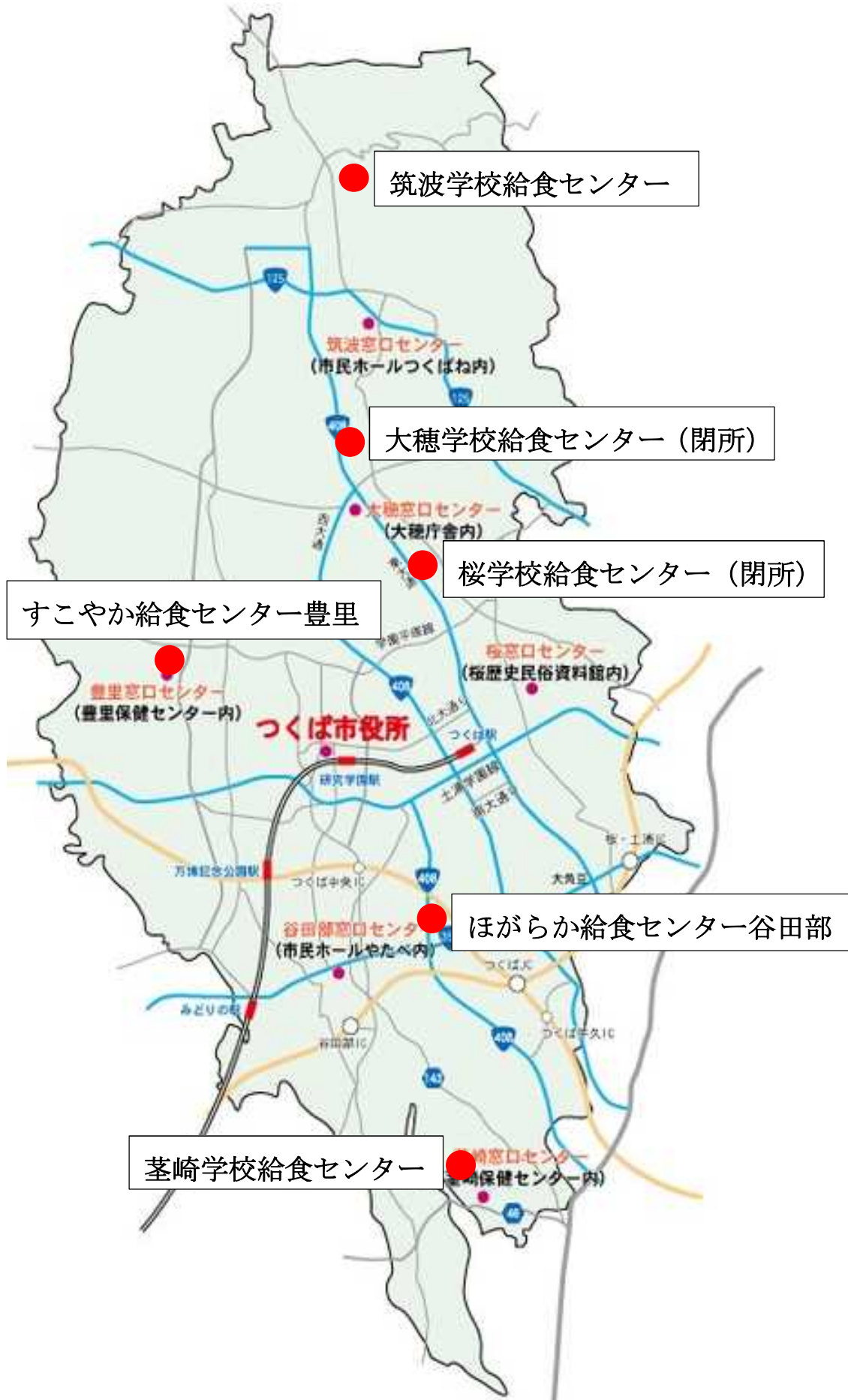
《図1》現センター及び閉所センター位置図