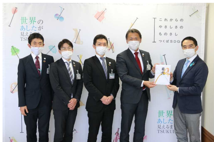
写真データ提供可