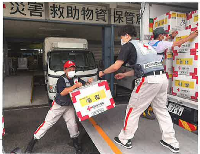
ボランティアの協力で迅速に被災地へ▶

日本赤十字社では、医療救護活動に加え、避難所生活を余儀なくされた被災者の方々に、こころと体を温めるための「毛布」、感染予防に役立つマスクやウエットティッシュなどを収納した「緊急セット」など、様々な救援物資をお届けしました。