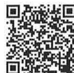
◀感染予防学習 坂東市立猿島中学校