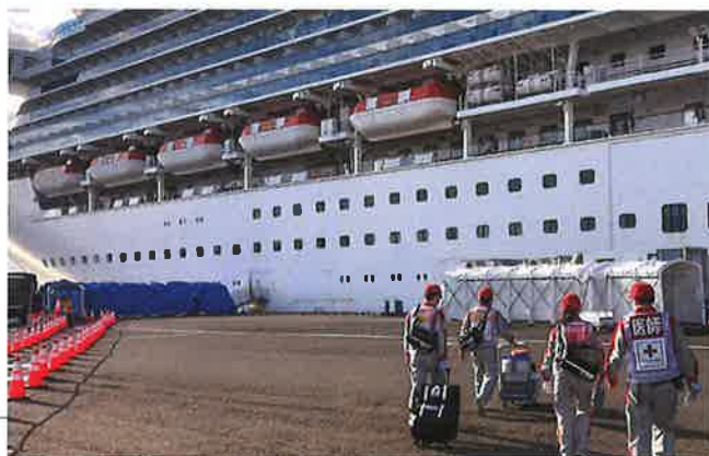
クルーズ船内の救護に向かう医療チーム ▶

厚生労働省からの派遣依頼に基づき、この双方に医療チームを派遣し、延べ255名の赤十字職員が、多くの方々の健康確保に努めました。