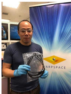
(株)ワープスペース