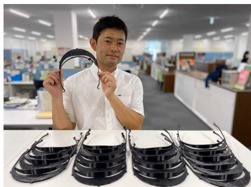
3Dプリンターで製作したフェイスシールド (筑波大学スポーツResearch & Development コア)

今回の取り組みでは、スタートアップの機動力が効果的に発揮され、現場のニーズの聞き取りから製作・納品までを短期間で実現することができました。