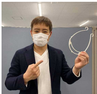
地球科学可視化技術研究所(株)