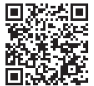
市ホームページ 「狂犬病予防注射 (集合注射)」

国や茨城県により、つくば市が対象地域に含まれる緊急事態宣言や外出自粛要請が発令された場合には、延期もしくは中止となります。最新の情報については、市ホームページや電話にて御確認いただきますようお願いいたします。