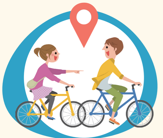
サイクリングで旧筑波町地域を巡る