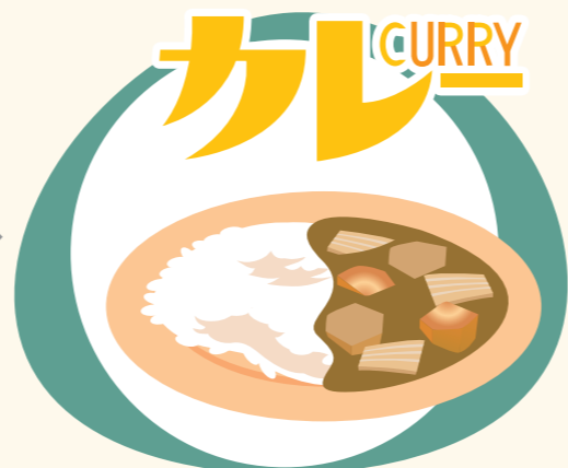
華の幹で食事を楽しむ