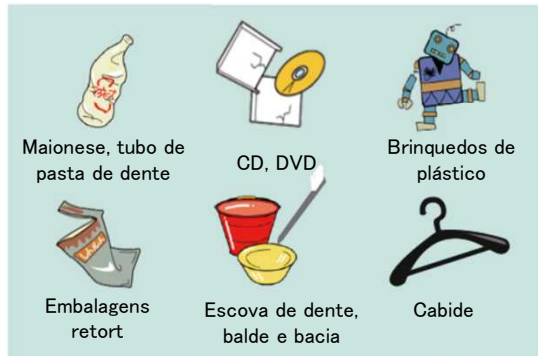
Maionese, tubo de pasta de dente

Estes produtos devem ser descartados como lixo queimável