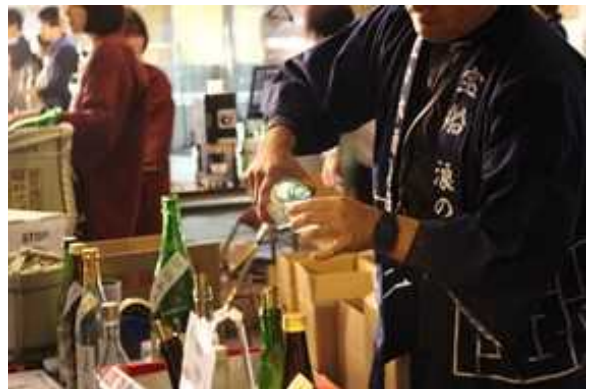
※写真データ提供可

公共空間活用実証実験「つくばペデカフェプロジェクト」のひとつとして、「第五回食と酒東北祭り」を開催します。