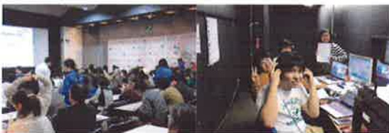
上映会の模様（左） 運営スタッフを筑波学院大学の学生が担当し（右）