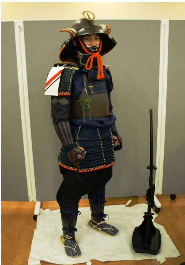
小田家関係甲冑 装着状況