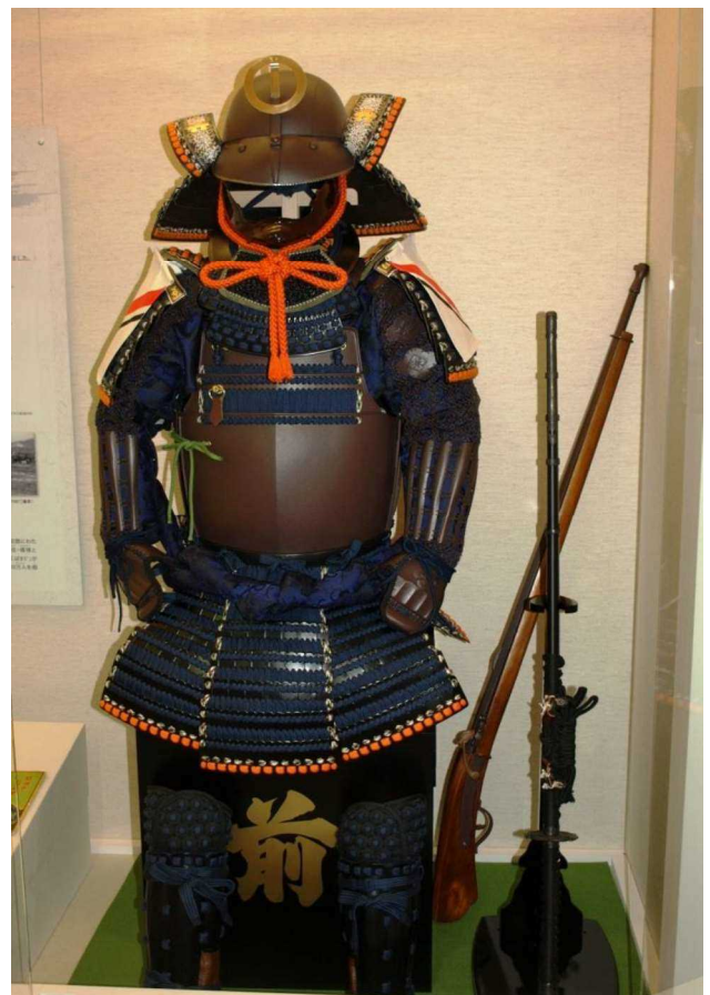
小田家関係甲冑 展示状況